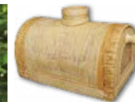
Набор для пикника. Хлебница. Жуйков А.В.