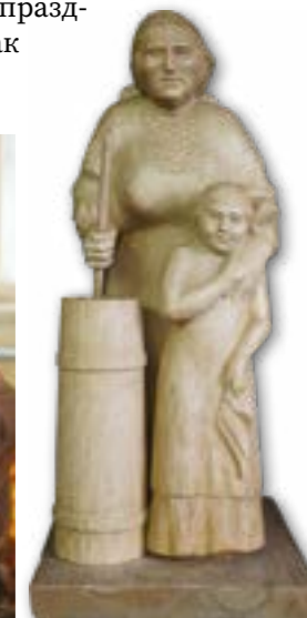
Скульптура «Будни». Сидоров Г.Е.