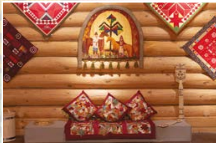
Экспозиция выставки «Тепло женских рук». 2020 г.