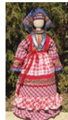
Кукла «Вадор кен» («Невеста»). 2019 г. Токмина Н.Н.