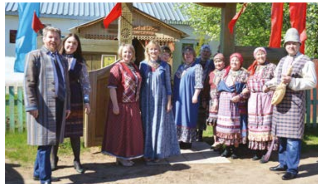
Коллектив Узей-Туклинского Дома ремёсел. 2020 г.

лило коллективу впоследствии реализовываться в тематике самых разных жанров. В Узей-Тукле навыками худ. обработки природ. мат-лов владели лишь единицы. Выход нашли в самообразовании, освоении разл. техник методом проб и ошибок, изучение опыта в др. р-нах, сотрудничества с немногочисл. односельчанами – умельцами, а также приглашали на работу выпускников учеб. заведений ДПИ. Тогда же было решено, что осуществление задачи возрождения и сохранения ремёсел невозможно без привлечения к участию юных узей-туклинцев, и вскоре рядом со старшими стали трудиться дети. Поле выбора жанра и тематики было обширным. Каждый из мастеров