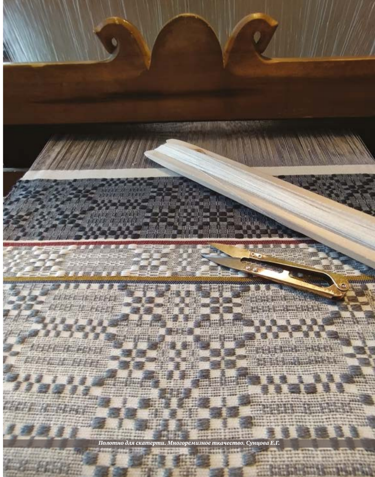
Полотно для скатерти. Многоцветное ткачество. Сунцова Е.Г.