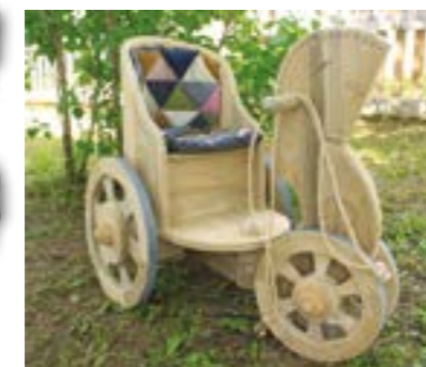
Панно «Три свадьбы». Каталка «Лошадка». 2019 г. Автор идеи: Сидоров Г.Е. Исполнители: Чермаков С.А., Сунцова Е.Г.