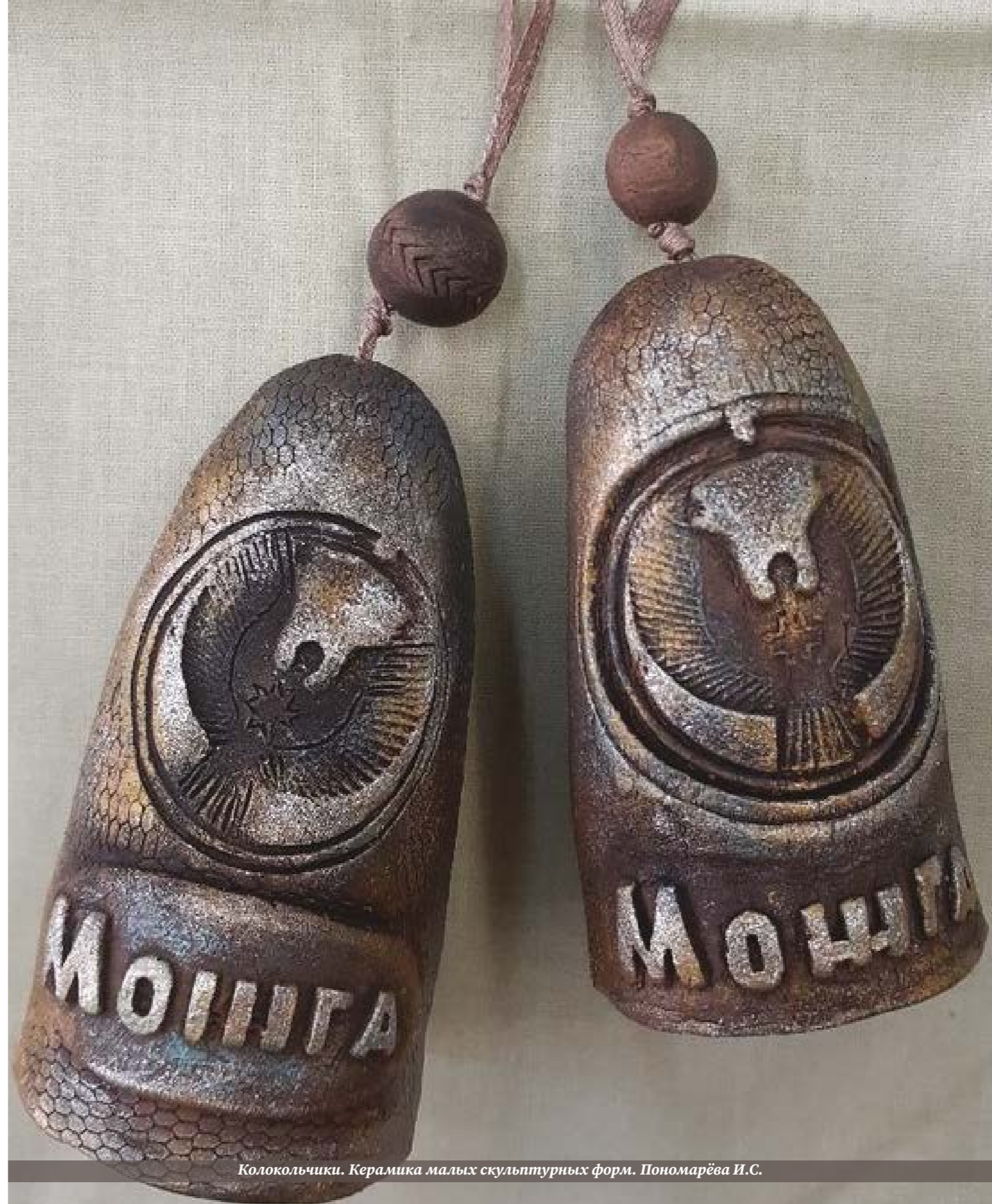
Колокольчики. Керамика малых скульптурных форм. Пономарёва И.С.