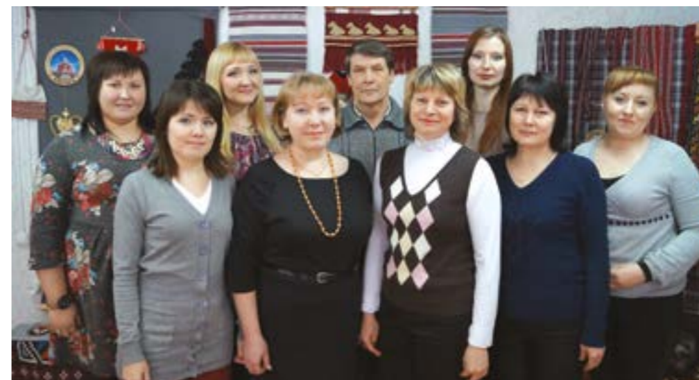
Коллектив Можгинского районного Дома прикладного искусства и ремёсел. 2014 г.