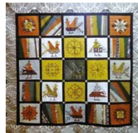
Современное монисто. Панно «Цветы и птицы». Баженова В.В.