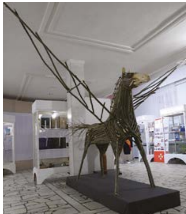
Арт-объект «Бурдо вал» («Крылатый конь») Скульптура «Ведьма». Щепин С.А.