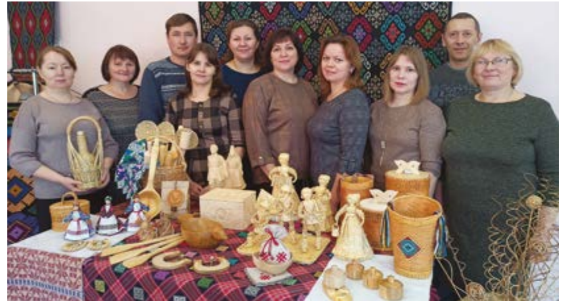
Коллектив отдела декоративно-прикладного искусства и ремёсел Центра удмуртской культуры Киясовского района. 2021 г.

и ремёсел; организуют этногр. эксп. по деревням р-на и респ., изучают музейные экспонаты. Изделия методистов ежегодно высоко оцениваются экспертами худ.-экспертного совета, занесены в Электронный каталог изделий ДПИИР. Методисты работают с надомниками, ведут кружковую деятельность, принимают участие в респ. традиц. праздниках, выст., достойно представляют р-н и Удмуртию на всерос. и междунар. выст., конкурсах и фестивалях: респ. проекте «Мастерская удмуртского ткачества» (с. Киясово, 2013), Междунар. фестивале «Парковая скульптура» (пос. Ува, 2015), Всерос. фестивале ткач-ва «КРОСНА» (г. Ижевск, 2015), межрегион. фестивале «Краснокамская игрушка» (г. Краснокамск, Респ. Башкортостан, 2012), Междунар. празднике обрядовых культур фин.-угор. народов «Чудный карнавал» (с. Пеши-