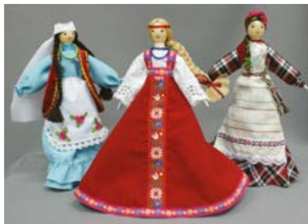
Куклы в национальных костюмах. Шамшурина Л.А.