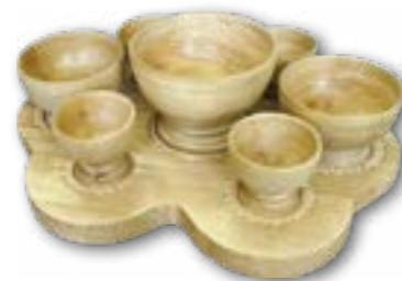
Диван. Набор «Семейные чашки любви». Столярно-токарное ремесло. Волков П.В.