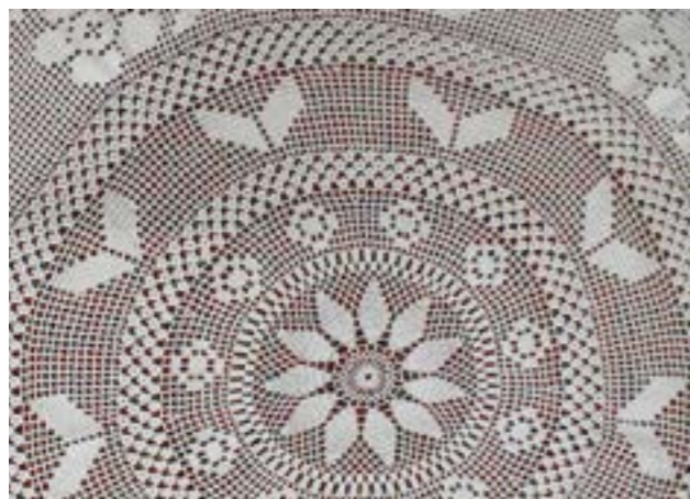
Скатерть. Филейное вязание. Шамшурина Л.А.