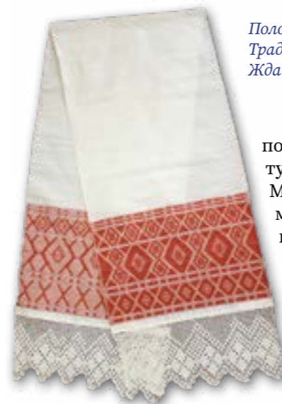
Полотенце удмуртское. Традиционное ткачество. Жданова С.П.

по ткач-ву отд. «Центр туризма и ремёсел» МБУ «Завьяловский музей истории и культуры». За время работы в Центре проявила себя как высококвалифиц. специалист широкого профиля. Проводит стажировки, мастер-кл.