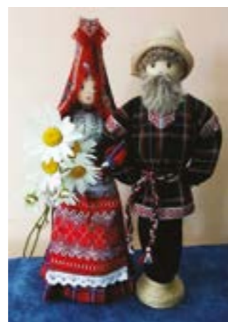
Куклы «Пара». Моисеева Т.В.