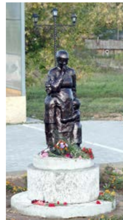
Памятник «Детям ВОВ 1941–1945 гг.». Камашев П.А. с. Бабино. 2021 г.

ткачестве Завьяловского р-на» для программы «Национальный хоровод». Награждена Почёт. грамотами Мин-ва нац. политики УР (2015), Адм-ции МО «Завьяловский район» (2009), Упр. культуры Завьяловского р-на (2014); Благодарностями Мин-ва культуры УР (2015), Упр. культуры Завьяловского р-на (2016).