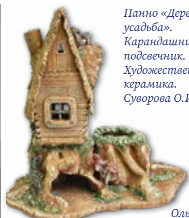
Панно «Деревенская усадьба». Карандашница-подсвечник. Художественная керамика. Суворова О.И.