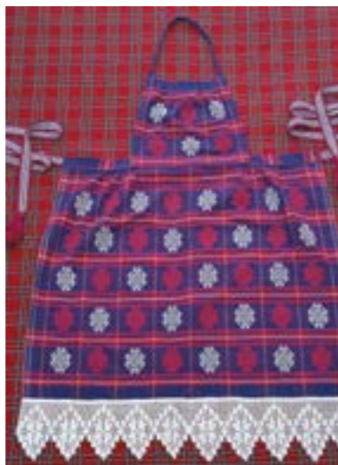
Рубаха. Современный костюм. Моисеева Т.В.