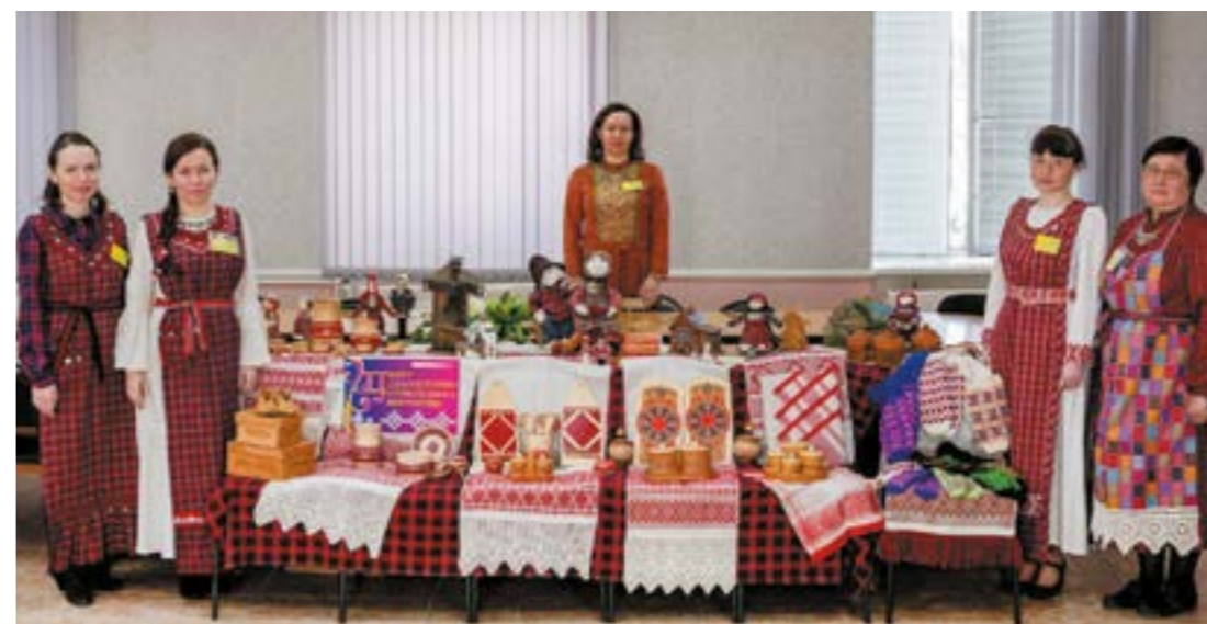
Выставка изделий мастеров, посвящённая 10-летию Центра декоративно-прикладного искусства. 2018 г.