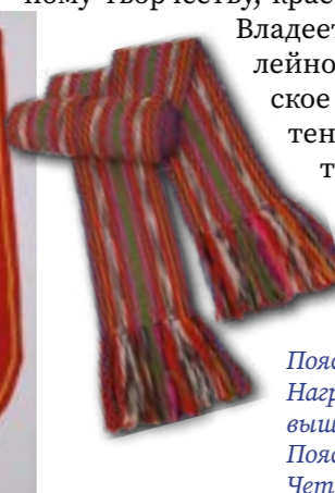
Поясок. Плетение. Нагрудник. Лоскутная аппликация, вышивка. Пояс. Традиционное ткачество. Четкарёв А.Е.