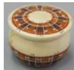
Шкатулка. Наборы кухонные. Роспись по дереву. Михалецкая О.Н.