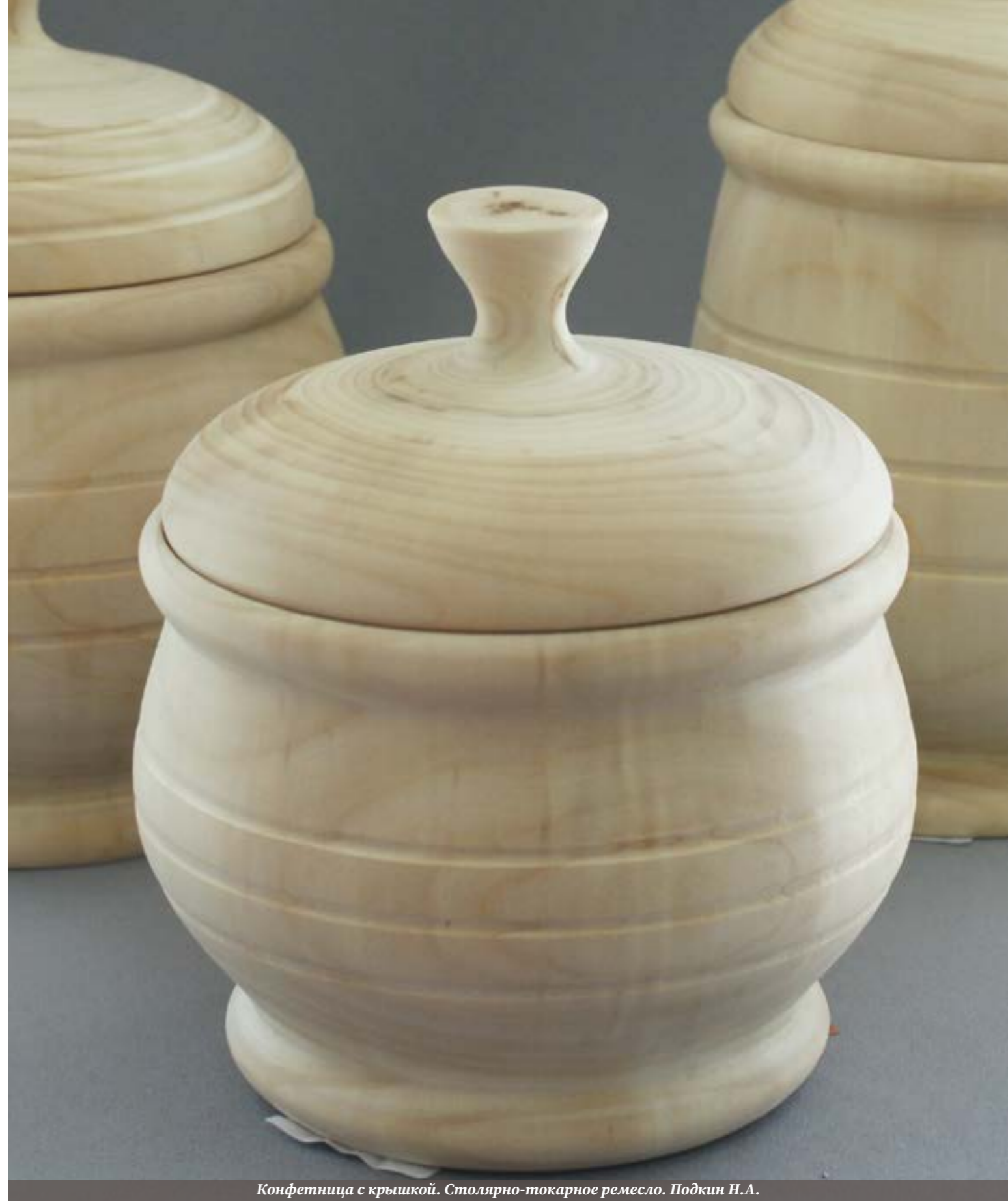
Конфетница с крышкой. Столярно-токарное ремесло. Подкин Н.А.