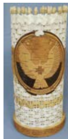
Ваза. Художественная обработка бересты. Мельников В.Н.