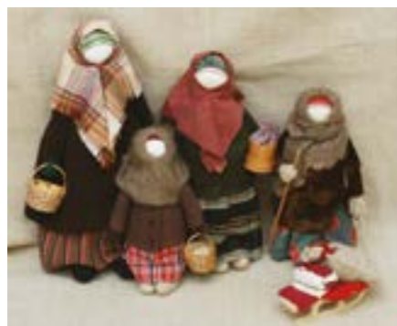
Экспозиция «На ярмарку». Народная игрушка. Чепкасова Т.И.