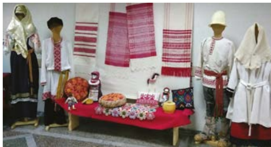
Выставка изделий мастеров ЦДПИиР в ДК «Звёздный». пос. Новый. 2019 г.