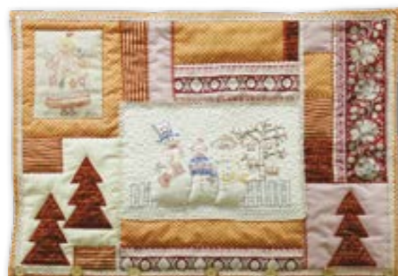
Панно «Рождественская сказка». Лоскутное шитьё. Золотарева С.Л. Комплект: головной убор – сорока, куртка джинсовая и сумка. Лоскутное шитьё. Золотарева С.Л., Даркова С.В.