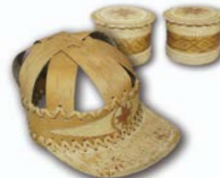
Фуражка. Шкатулки. Художественная обработка бересты. Загитов А.Ф.