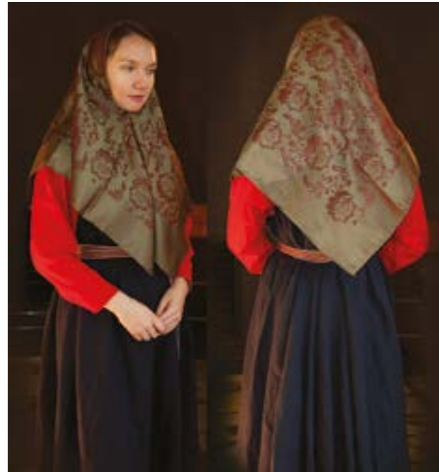
Старообрядческий костюмный комплект: платок, рубаха, сарафан, пояс. Традиционный костюм. Башкирцева И.А., Чепкасова Т.И.

обл.), «Высокий берег» (Сарапульский р-н), «Петровская ярмарка» (с. Елово, Пермский кр.), «Очерская ярмарка» (г. Очер, Пермский кр.), «Спасская ярмарка в Елабуге» (г. Елабуга, Респ. Татарстан) и мн. др.; III Межрегион. конкурса-выст. мастеров нар. тряпичной куклы «Куклодельница» (г. Чайковский, Пермский кр.); ярмарки «Светлая пасха» (г. Чайковский), а также ежегод. район. мероприятий «Тракторный биатлон», «Шудо табань», «Перевозинский засольник». Изделия, занесённые в эл. каталог ДПИИР: костюм свадеб. «Уральская парочка – «розовик» (2016); старообрядческий костюмный