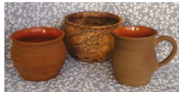
Скульптура керамическая «Встреча гостей». Посуда керамическая. Художественная керамика. Меднова О.В.