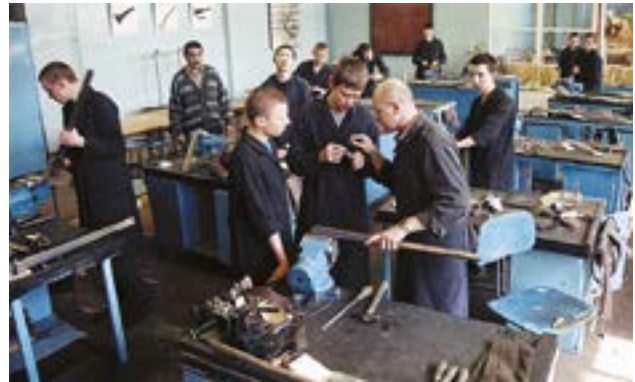
Учебно-производственные мастерские школы ружейного мастерства

клюзив», «Коллекционный». Изделия Ш.р.м. экспонировались на престижных оружейных выст. «РОСТ» (Ижевск), выст. «Охота и оружие» (Москва), междунар. оружейной выст. «Shot Show» (США). С 1999 шк. ежегод. готовила выст. экспонаты на междунар. оружейную выст. ИВА (Нюрнберг, Германия). В мар. 2010 на выст. «ИВА-2010» были представлены 5 уник. образцов высокохуд. оружия, изготовленные мастерами и учениками шк.