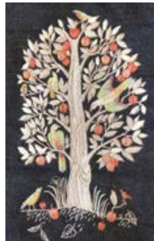
Изделия с вышивкой. Шарапова Т.В.