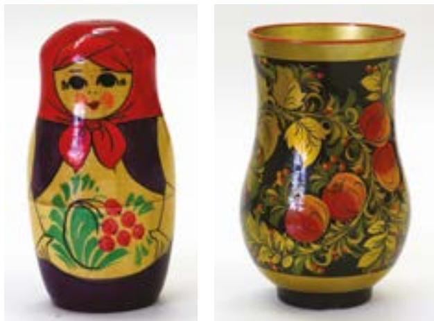
«Матрёшка». «Молочник». Изделия Шольинского леспромхоза. 1978 г. Из фонда НМ УР им. К. Герда

СССР за роспись медового набора. В 1991 коллективу присуждено две серебряные медали за изделия с шольинской росписью. Сувениры Шольинского ЛПХ приобретали не только в Шарканском р-не и в Удмуртии, они расходились по всему миру. Значительное количество сувениров было отправлено в Финляндию, Германию, Египет и др. страны. Уникальность шольинской росписи в том, что при скромной цветовой палитре художники издавали безукоризненно гармоничные узоры. История притягивает сегодня в памяти односельчан. Проводятся фестивали, музейные уроки, мастер-классы, пишутся грантовые проекты, посвященные шольинской росписи.