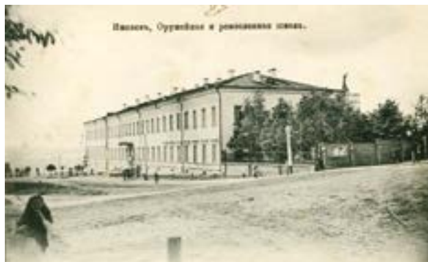
Оружейная и ремесленная школа.

ШКОЛА РУЖЕЙНОГО МАСТЕРСТВА им. Леонарда Васева (АО «Ижевский механический завод»), структурное подразделение пр-тия, на к-рое возложены задачи по подготовке квалифицир.