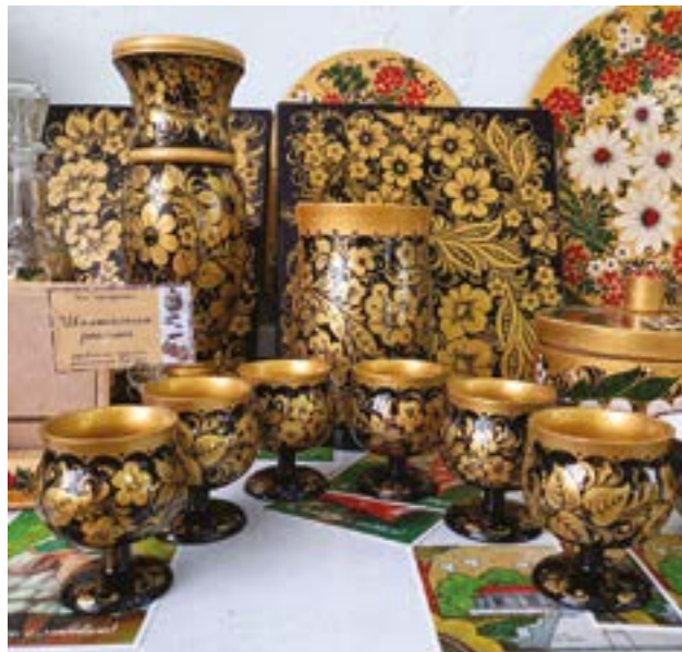
Сувенирная продукция. Шольинский леспромхоз