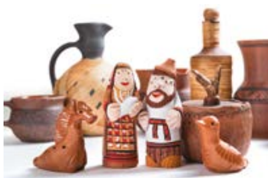
Керамические изделия мастерской «Мугур»