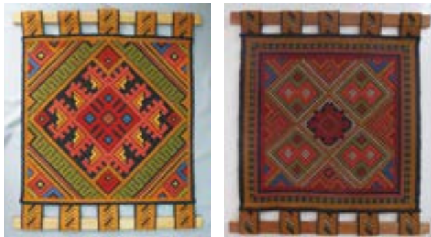
Панно «Пужы» («Узор»). Ткачество. Мансурова Н.Г.