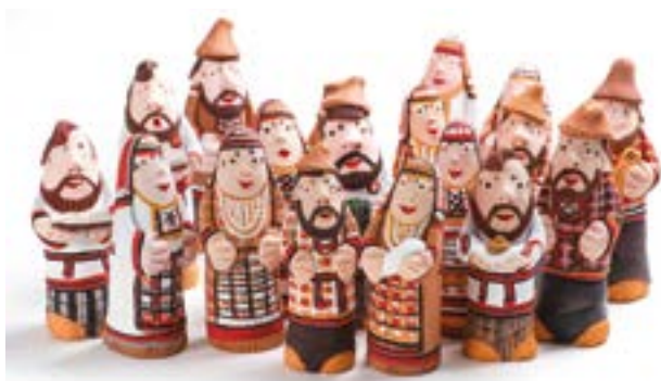
«Весь честной народ». Керамика, роспись