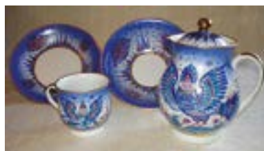
Сервиз «Чаяпитие». Детский набор «Сказка». Банников В.В.