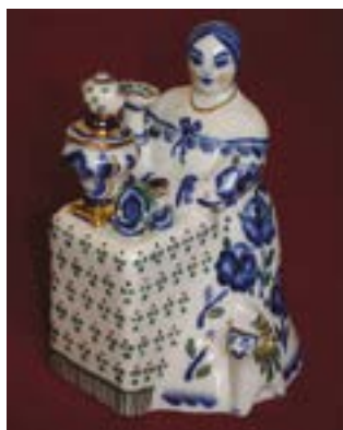
Малая пластика «Чаепитие». Яйцо. Фарфор, роспись. Банникова Е.И.