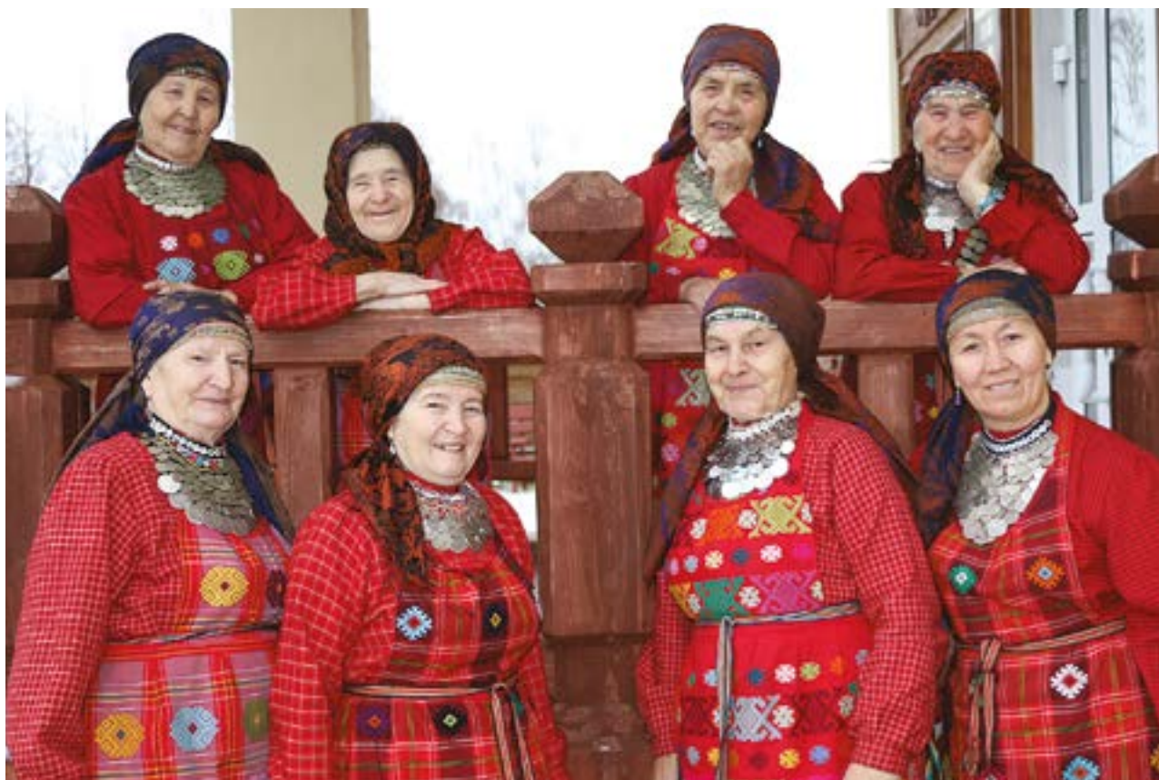
Коллектив «Бабушки из Бураново»

дения культуры, сохраняющие память народа. В Удмуртии среди них система Центров и Домов ремёсел. Так возникает точка пересечения между производством сувениров и процессом формирования ценностей терр. Культ. брендами могут стать редкие сохраненные и возрождённые технологии ДПИ в местах их традиц. бытования, т.к. они неотрывны от всего комплекса нематер. и матер. культуры терр. Узорное ручное ткач-во вполне может претендовать на звание «культурного бренда Удмуртии». Его уник. в масштабе Волго-Уральского региона и России в значит. разнообразии технол. приёмов и локальных традиций, при сохранении нац. узнаваемости, общности худ. строя изделий. Эти качества заложены географией региона на пересечении славянского, фин.-угор., тюркского миров, отзывчивостью к культуре соседних народов, устойчивостью традиций в силу консервативности жизненного уклада дерев. нас., усилиями органов культуры по сохранению и развитию традиц. ДПИ и ремёсел в 1990–2010-е. Узорное ткач-во востребовано современ-