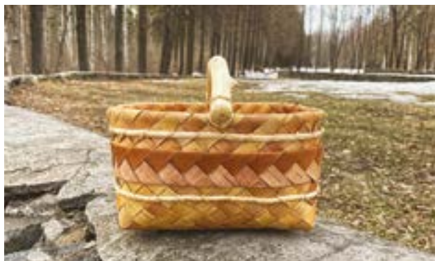
Корзина. Обработка бересты (плетение). Коренева С.В.

для горожан выплетали сумочки, портфели для бумаг, ящики для перчаток. В кон. XIX в. на Вятке были популярны трости, собранные из надежных на стержень кружков бересты. Заготавливают бересту в нач. лета, в конце мая-июне, когда берёза полна соков, и береста легко отстает от остальной коры. Это процедура не вредит дереву, через несколько лет на нём снова вырастает белая кора. Пласты разрезают на заготовки нужного размера, а остатки нарезают на полоски для плетения. Бересту цилиндр. формы снимают со срубл. деревьев «чулком», что даёт возможность сделать двухслойные не пропускающие влагу туеса «сколотни», бураки, величина к-рых «различна, начиная от стакана и доходит до ведра». Совершенствуясь из века в век технологию обработки бересты, удмурты находили новые способы изготовления из такого мат-ла вещей для своего быта. Повсеместно удмуртами плелись пестери, бахары (род туплей), лапти, чаши, солонки, туеса («сарва», «лянэс»). Это берест. сосуд цилиндр. формы со вставным (фиксированным) дер. дном и крышкой. В Глазовском у. были широко распространены дет. колыбельки, часто оформлявшиеся орнаментом в технике тиснения или резьбой. Так, на Казанской науч.-пром. выст. 1890 такая зыбка (мучко) из бересты вызвала положит. отзывы. В печати сообщалось: «Вотяки делают из бересты красивые люльки и даже игральные карты». Некрасов, крестьянин Бисеровской вол. Глазовского у. за выплетенные карты, отличившиеся своей оригинальностью, был награждён похвальным листом.