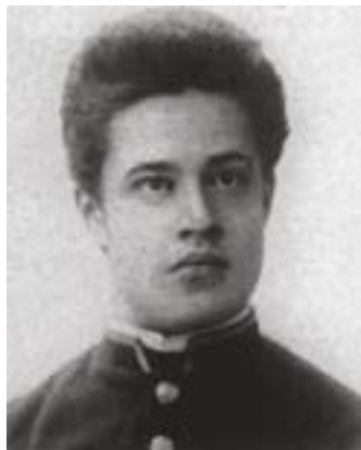
Богаевский Пётр Михайлович

Соч.: Очерки быта Сарапульских вотяков // Сборник материалов по этнографии при Дашковском музее. Вып. III. М., 1888; Очерки религиозных представлений вотяков // Этнографическое обозрение. 1890. № 1, 2, 4.