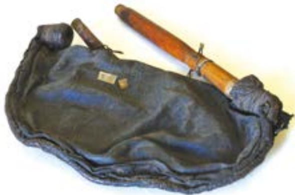
Быз. Конец XIX в. Из фонда НМ УР им. К. Герда